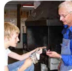
Samarbeider med nye mennesker