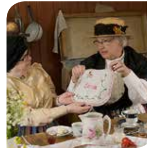
Føler seg mer kreativ