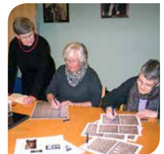
Lærer nye ting

Prosjektet Pride, Joy and Surplus Value undersøkte fordelene ved å være frivillig ved museum, og kartla gode eksempler på rekruttering og administrasjon av frivillige. Prosjektet var et samarbeid mellom The Nordic Center of Heritage Learning and Creativity, Jamtli og Gotland Museum i Sverige, Museene i Sør-Trøndelag og Maihaugen i Norge, og Ringkøbing Skjern i Danmark. Med bakgrunn i spørreundersøkelse og intervjuer har vi identifisert flere fordeler for våre frivilliges livslange læring og velvære. Eksempelvis lærer våre frivillige seg nye ferdigheter, får ny kunnskap og øker sin personlige utvikling og velvære.