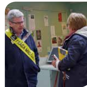
Føler seg hjelpsom