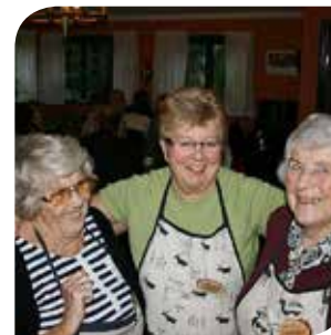
Får nye venner