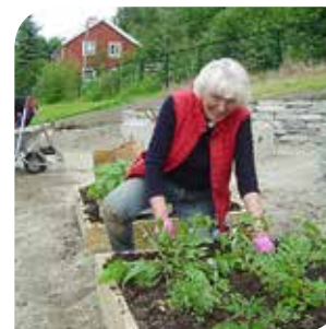
Bidra till samhället